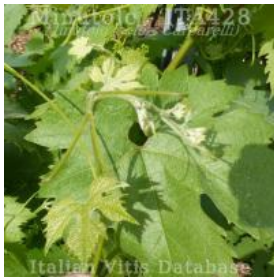
germoglio pagina superiore