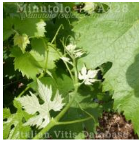
germoglio pagina inferiore