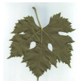
foggia pagina inferiore