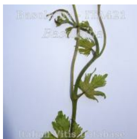
germoglio pagina inferiore