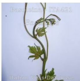
germoglio pagina superiore