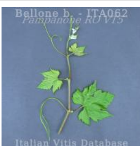
germoglio pagina superiore