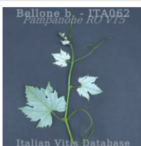
germoglio pagina inferiore