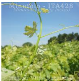
germoglio pagina inferiore