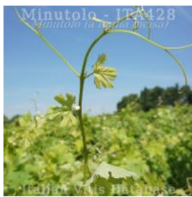
germoglio pagina superiore