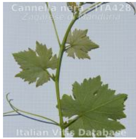
germoglio pagina inferiore