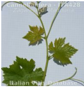
germoglio pagina superiore