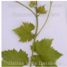
germoglio pagina inferiore