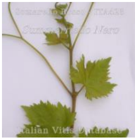
germoglio pagina superiore