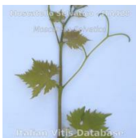
germoglio pagina superiore