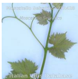
germoglio pagina inferiore