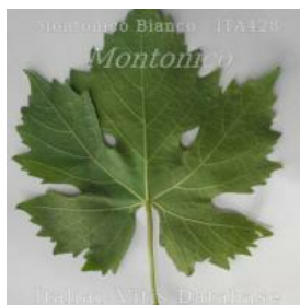
foglia pagina inferiore