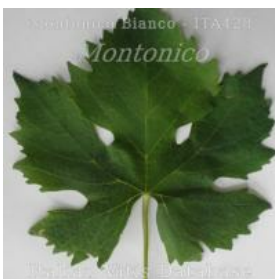
foglia pagina superiore