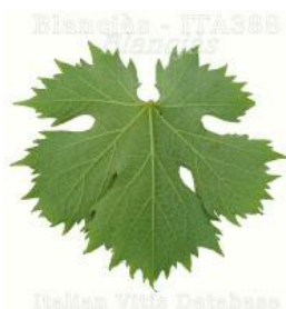
foglia pagina inferiore