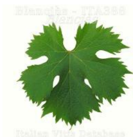
foglia pagina superiore