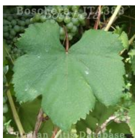
foglia pagina superiore