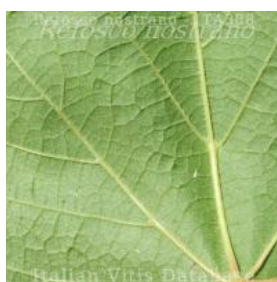
foglia pagina inferiore