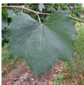
foglia pagina superiore