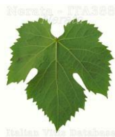
foglia pagina inferiore