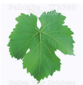
foglia pagina inferiore