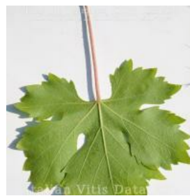
foglia pagina inferiore