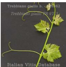
germoglio pagina superiore