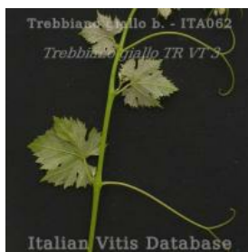
germoglio pagina inferiore