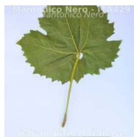
foglia pagina inferiore