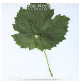
foglia pagina superiore