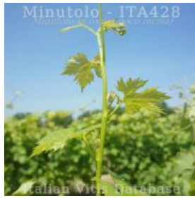
germoglio pagina inferiore