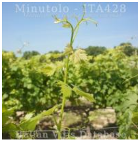
germoglio pagina superiore