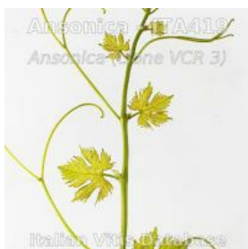
germoglio pagina superiore