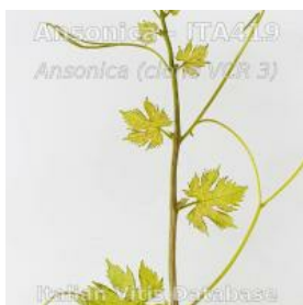
germoglio pagina inferiore