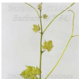
germoglio pagina superiore