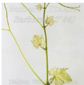
germoglio pagina inferiore