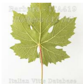
foglia pagina inferiore