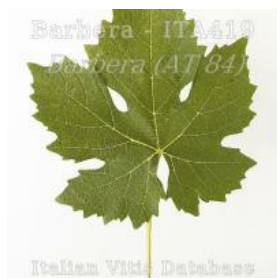
foglia pagina superiore