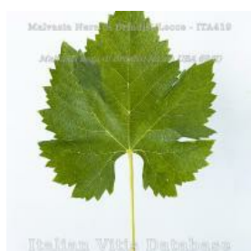
foglia pagina superiore