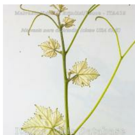
germoglio pagina inferiore