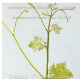
germoglio pagina superiore