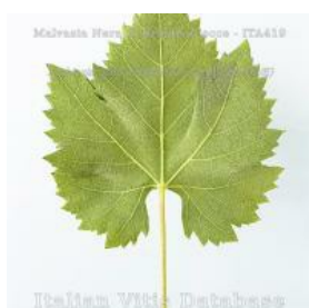
foglia pagina inferiore