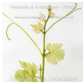
germoglio pagina inferiore