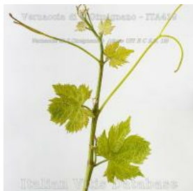
germoglio pagina superiore