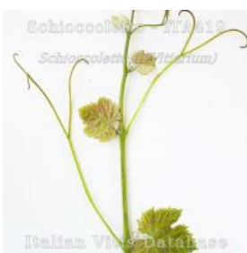
germoglio pagina superiore