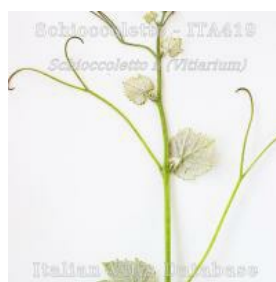
germoglio pagina inferiore