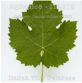
foglia pagina superiore