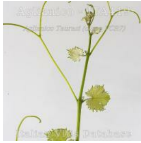
germoglio pagina superiore