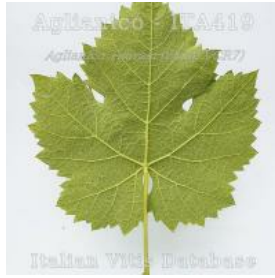
foglia pagina inferiore