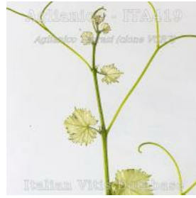
germoglio pagina inferiore