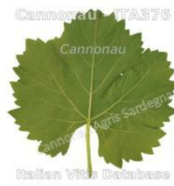
foglia pagina inferiore