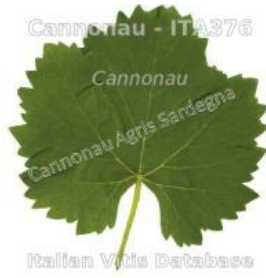
foglia pagina superiore