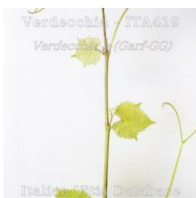
germoglio pagina superiore