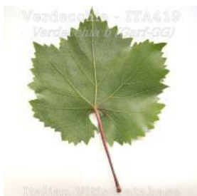
foglia pagina inferiore