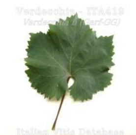
foglia pagina superiore