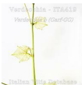
germoglio pagina inferiore