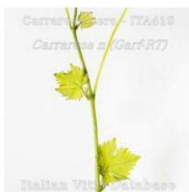
germoglio pagina inferiore