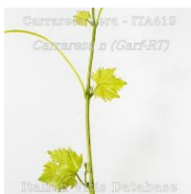
germoglio pagina superiore