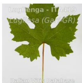
foglietta pagina superiore