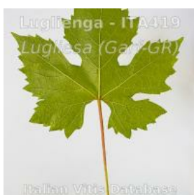
foglietta pagina inferiore