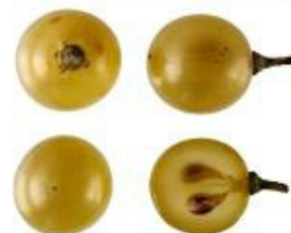
Italian Vitis Database