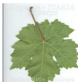
foglia pagina inferiore