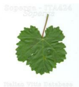
foglia pagina superiore