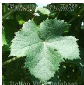
foglia pagina superiore