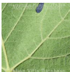
foglia pagina inferiore