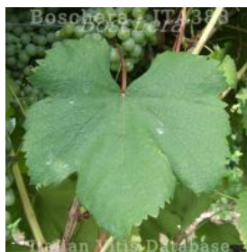
foglia pagina superiore