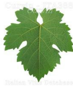
foglia pagina inferiore