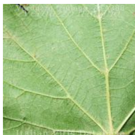
foglia pagina inferiore