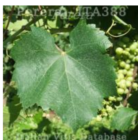
foglia pagina superiore