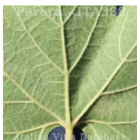
foglia pagina inferiore