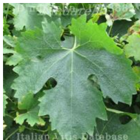
foglia pagina superiore