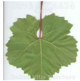
foglia pagina inferiore