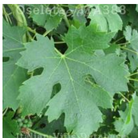
foglia pagina superiore