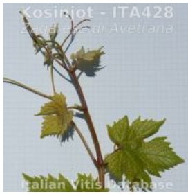
germoglio pagina superiore