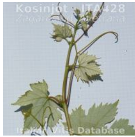
germoglio pagina inferiore