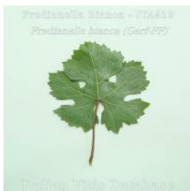
foglia pagina inferiore