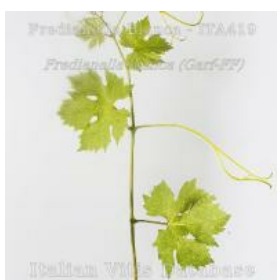
germoglio pagina superiore