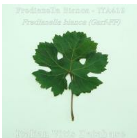
foglia pagina superiore