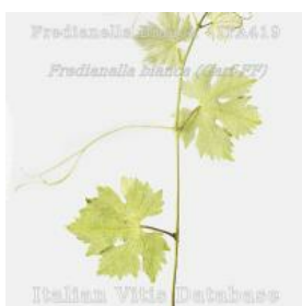
germoglio pagina inferiore