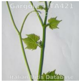
germoglio pagina inferiore