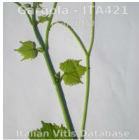
germoglio pagina superiore