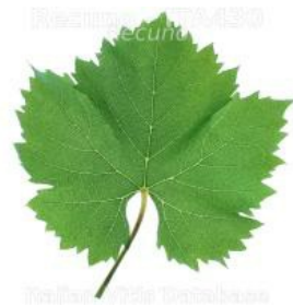
foglia pagina inferiore