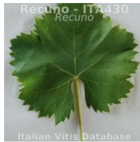
foglia pagina superiore